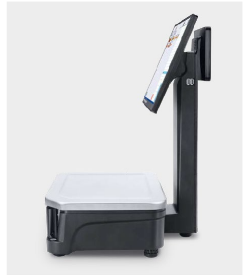
bTouch Smart VCO Scale